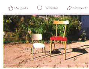
'NIN MÁIS NAIS NIN MÁIS NEN@S' Na fotografía aparecen dúas cadeiras baleiras, unha máis grande que representa ás mulleres e outra máis pequena que representa aos nenos e nenas que sofren a violencia c... Ver máis