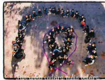
'ENLAZANDO IGUALDADE' Coa presente fotografía preténdese concienciar dende idade temperás a importancia da tolerancia, do respecto e da igualdade de xéneros. A imaxe só é un pequeno reflexo do que se t... Ver máis