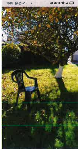
'A OSCURIDADE QUE DEIXA A PERDA' A crúa realidade dunha cadeira baleira, a perda dos ser quando tu coñecido'