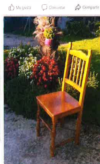
'VISIBILIDADE Á CADEIRA' Un raio de luz e flores para a ausencia'