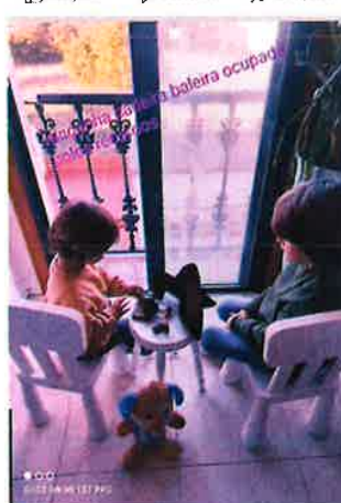
'NIN UNHA CADEIRA MÁIS BALEIRA OCUPADA POLOS RECORDOS' A foto intenta reflexar o vazio que deixa unha nai. Os obxectos que aparecen son indicativos e propios dunha MAMÁ ( a súa cadeira, as súas cousas... Ver máis