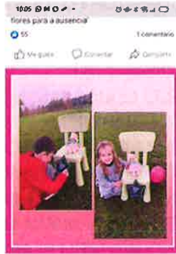
'XOGANDO CUNHA CADEIRA BALEIRA' Aquí dous nenos nunha tarde calquera xogando cunha cadeira baleira. Xogan a adornala cunha estrela na que debuxan un corazón, a sentar unha boneca... Logo farán dela un... Ver máis